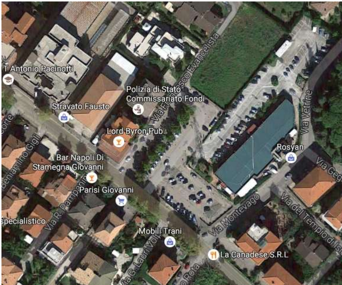
Piazza F. Evangelista